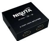
NS-VSH2E » 2 PUERTOS