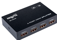
NS-VSH4E » 4 PUERTOS