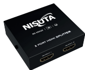
NS-VSH2E » 2 PUERTOS